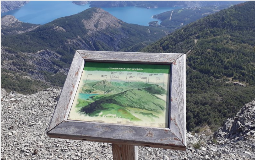
Vue sur le lac de Serre-Ponçon