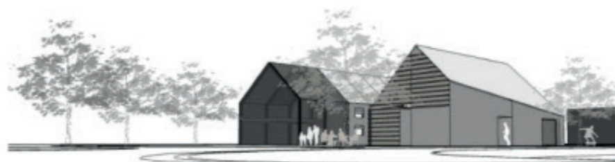
Vues d'ensemble du site depuis le rond-point de la RN94

Le dépôt du permis de construire est prévu au printemps 2021 pour un démarrage des travaux 6 mois plus tard.