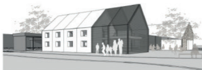
Vue du futur bâtiment de l'Office du tourisme au sud